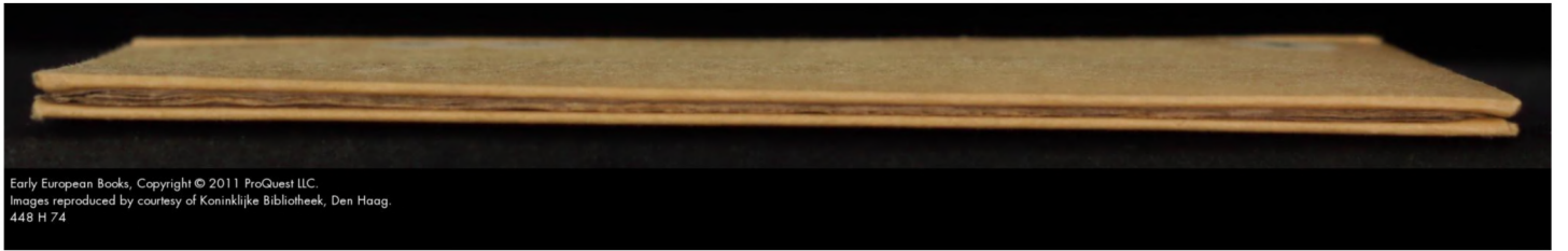
Early European Books, Copyright © 2011 ProQuest LLC. Images reproduced by courtesy of Koninklijke Bibliotheek, Den Haag. 448 H 74